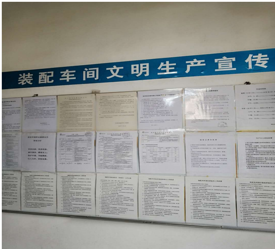
图9 厂务公开栏展示及优秀员工宣传栏

(3) 健全员工代表大会制度。公司支持每年一次召开员工代表大会让员工积极参与企业管理，加强企业民主管理，提高企业凝聚力，着力营造“乾龙”独到企业文化。此外，凡提交公司董事会决策的企业重大问题，先经员工代表大会讨论，使方案更加完整、更有群众基础。公司将企业发展目标、核心竞争力、员工切身利益等问题都向大会报告，并赋予员工代表对公司重大问题的知情权、参与权、建议权、监督权和民主评议权。