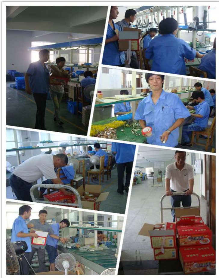
图 12 夏季送清凉活动

公司坚持以人为本的发展理念，认真落实国家政策，与职工签订劳动合同率达到 100%，并为所有职工办理五险，参保率 100%。公司有职工食堂，实行餐补制度，为外地员工及其家属免费提供设施齐全的员工宿舍，还为职工提供图书阅览室、健身房、篮球场等文体活动场所。在“三八”妇女节，开展以“静思生活、灵性工作”为主题的女职工心理健康知识讲座，公司特邀浙江海洋大学心理咨询丁老师给公司女职工作了心理健康知识讲座，针对女性日常工作及生活中容易遇到的压力和困难进行了疏导，并分发节日红包。