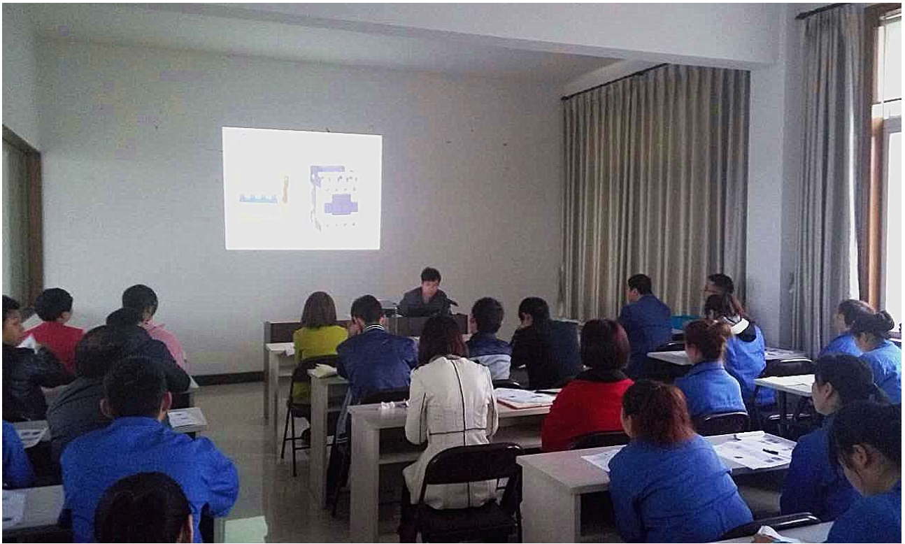
图 11 外聘老师授课